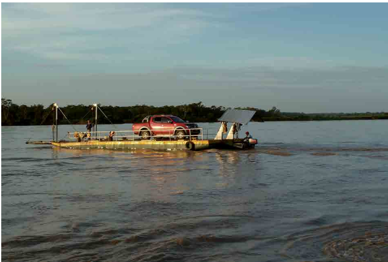
© Corporación Claretiana Norman Pérez Bello – Centro Claretiano de Investigación y Educación Popular

denuncia: “Salimos. Llegamos a Villavicencio. Ahí nos quedamos esa noche porque no había a donde [...]. Al otro día nos fuimos para INCODER y hablamos [...].Allá no nos dijeron nada. Nada. Entonces nos fuimos [...] a poner el denuncia [...]. [...] el señor que nos recibía el denuncia dijo: ‘Hermano, ¿ustedes tienen familia allá?’. ‘Sí, señor.’ Dijo: ‘Yo se lo puedo recibir el denuncia, pero si yo se lo recibo, más demoro en recibírselo cuando ya su familia se la han matado allá. ¿Después para dónde van?’. Le dije: ‘Nos vamos para Bogotá’. Me dijo: ‘Ponen el denuncia en Bogotá, pero cuando ellos haigan salido de allá, porque si no los matan a todos’.”.